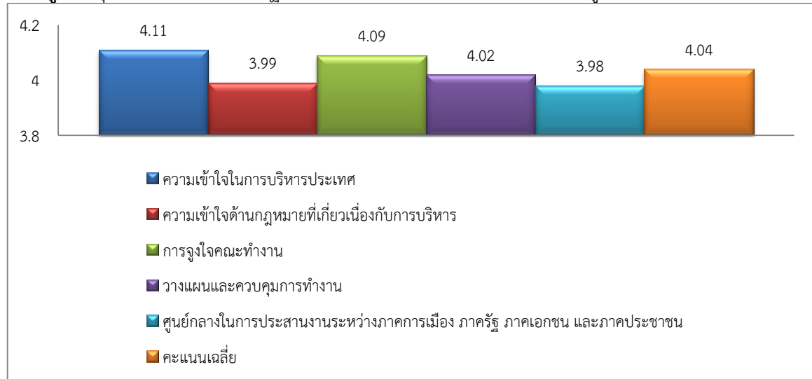
แผนภูมิ 1 คุณลักษณะของนายกรัฐมนตรีที่เหมาะสมกับสังคมไทยด้านความรู้ความสามารถ

จากแผนภูมิ 1 พบว่า ผู้ตอบแบบสอบถามได้แสดงความคิดเห็นต่อคุณลักษณะของนายกรัฐมนตรีที่เหมาะสมกับสังคมไทยด้านความรู้ความสามารถ มีคะแนนเฉลี่ย 4.04 (ระดับมาก) และได้แสดงทรรศนะว่านายกรัฐมนตรีควรมีความเข้าใจการบริหารประเทศมากที่สุด คะแนนเฉลี่ย 4.11 คะแนน และนายกรัฐมนตรีควรเป็นศูนย์กลางในการประสานงานระหว่างภาคการเมือง ภาครัฐ ภาคเอกชน และภาคประชาชนน้อยที่สุด คะแนนเฉลี่ย 3.98 คะแนน