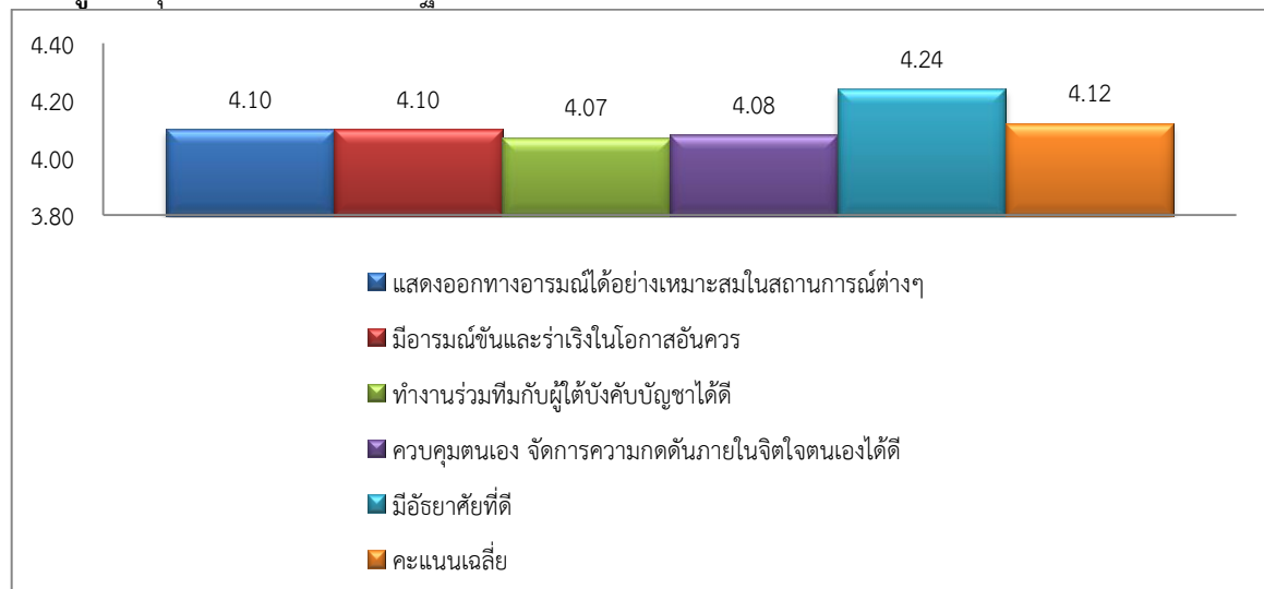
แผนภูมิ 2 คุณลักษณะของนายกรัฐมนตรีที่เหมาะสมกับสังคมไทยด้านอารมณ์และสังคม

จากแผนภูมิ 2 พบว่า ผู้ตอบแบบสอบถามได้แสดงความคิดเห็นต่อคุณลักษณะของนายกรัฐมนตรีที่เหมาะสมกับสังคมไทยด้านอารมณ์และสังคม มีคะแนนเฉลี่ย 4.12 (ระดับมาก) และได้แสดงทรรศนะว่า