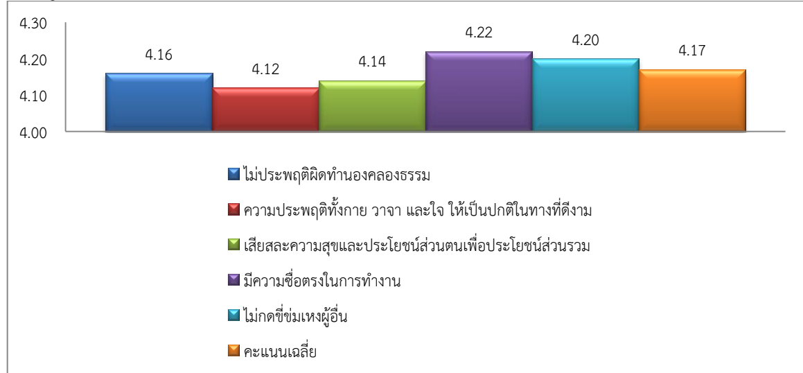
แผนภูมิ 3 คุณลักษณะของนายกรัฐมนตรีที่เหมาะสมกับสังคมไทยด้านคุณธรรม

จากแผนภูมิ 3 พบว่า ผู้ตอบแบบสอบถามได้แสดงความคิดเห็นต่อคุณลักษณะของนายกรัฐมนตรีที่เหมาะสมกับสังคมไทยด้านคุณธรรม มีคะแนนเฉลี่ย 4.17 (ระดับมาก) และได้แสดงทรรศนะว่านายกรัฐมนตรีควรมีความซื่อตรงในการทำงานมากที่สุด คะแนนเฉลี่ย 4.22 คะแนน และนายกรัฐมนตรีควรมีความประพฤติทั้งกาย วาจา และใจ ให้เป็นปกติในทางที่ดีงามน้อยที่สุด คะแนนเฉลี่ย 4.12 คะแนน